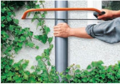
Heraussägen eines ca. 30 cm langen Fallrohrstückes