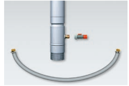
Das Verkaufset: Der RHEINZINK-Regensammler mit GARDENA Regulierstop, inkl. 1 Zoll-Verbindungsschlauch