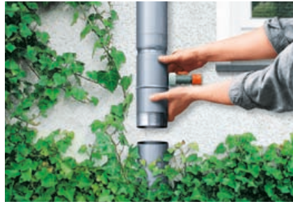
Einfaches Einsetzen und Justieren des RHEINZINK-Regensammlers